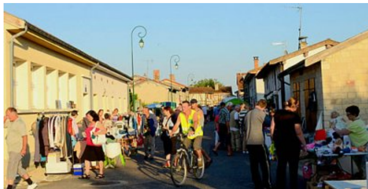
La place du village en 2016

03.26.72.64.56 ou 06.73.56.57.83 ou 06.15.41.70.27